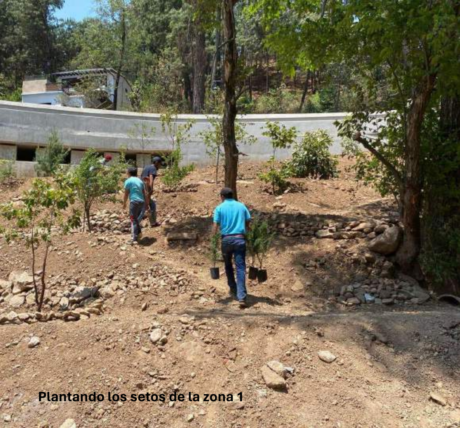
Plantando los setos de la zona 1