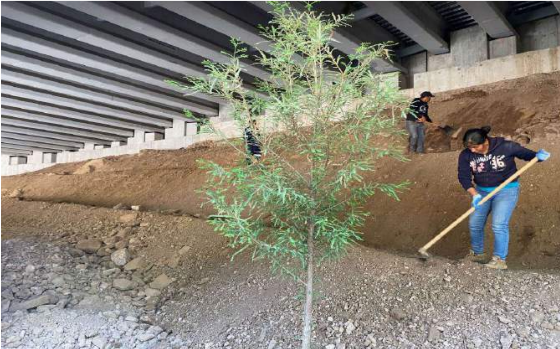
Conformación de la zona baja del puente