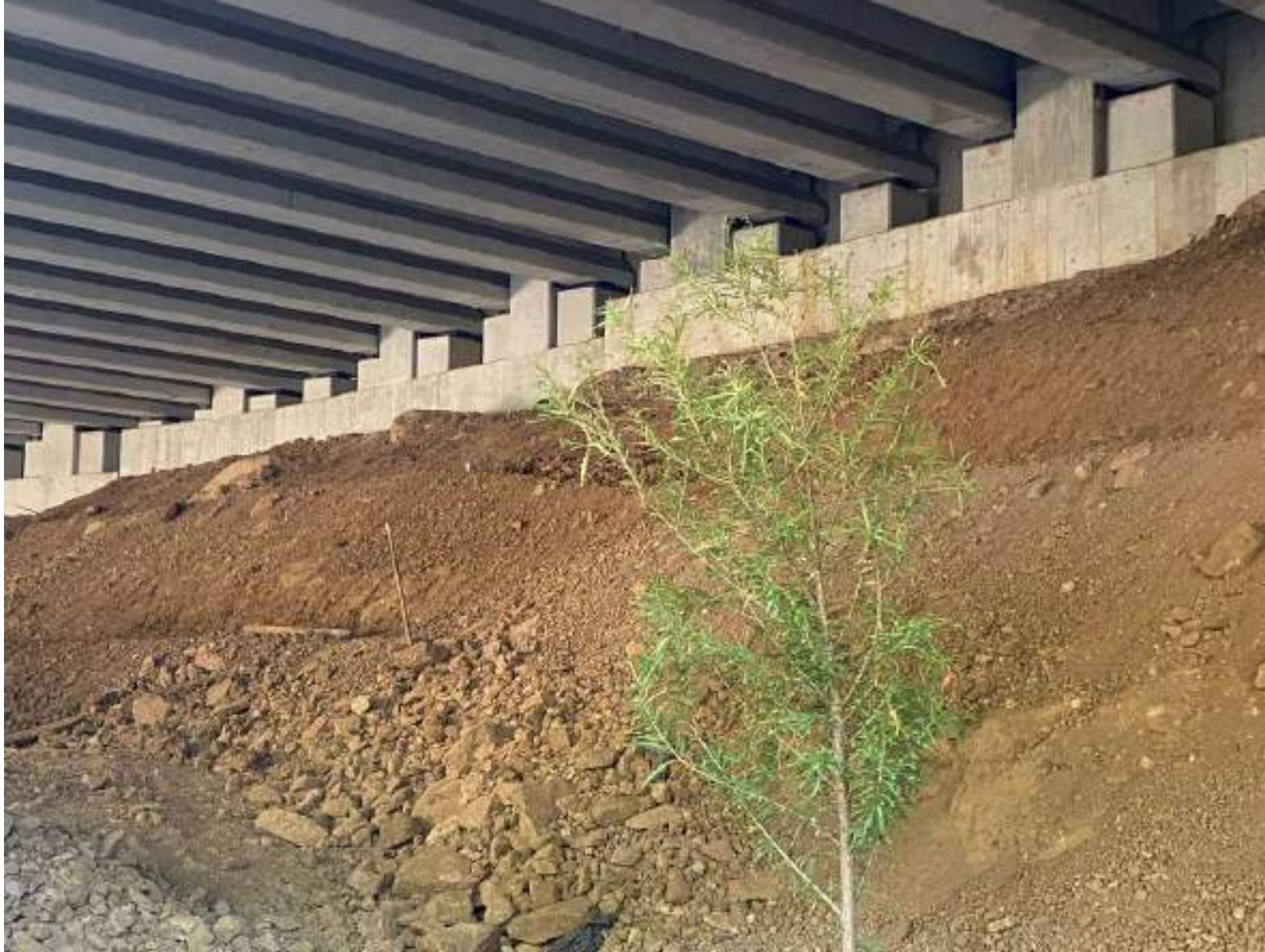
Conformación de la zona baja del puente