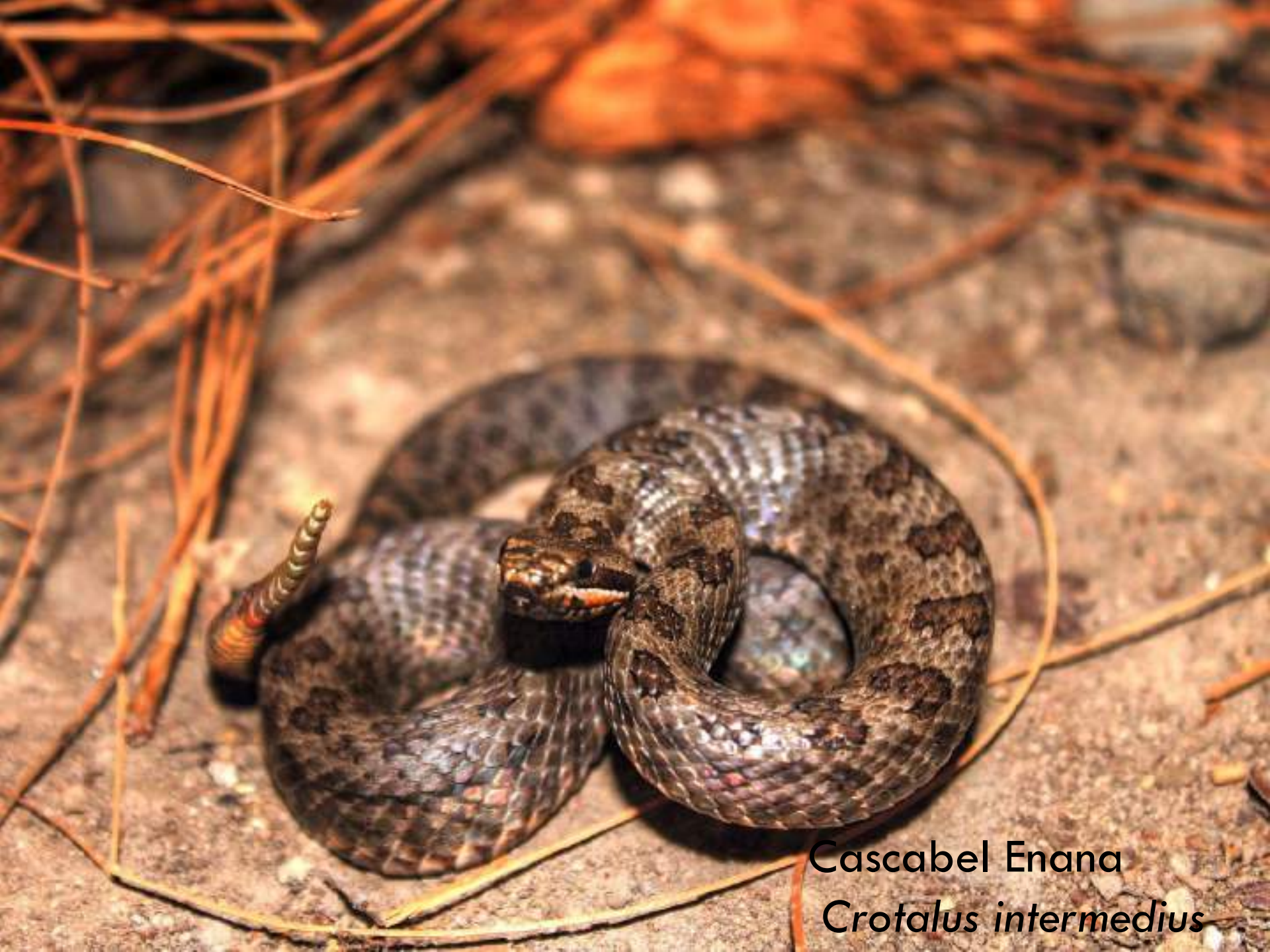
Cascabel Enana Crotalus intermedius