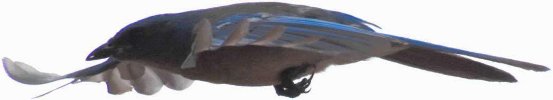
Chara Transvolcánica ( Aphelocoma ultramarina )

IDENTIFICACIÓN DE 32 ESPECIES DE AVIFAUNA IMPORTANTES PARA SU ECOSISTEMA